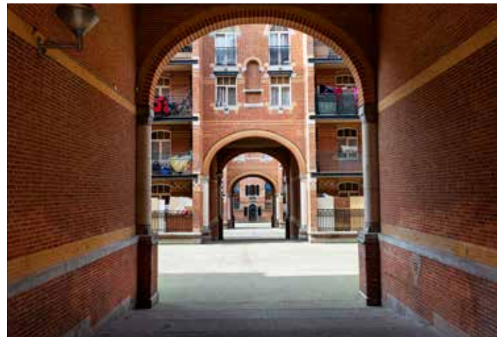
25. CITÉ HELLEMANS

→ Helemaal bovengekomen, kom je op een wat lager gebouw uit.