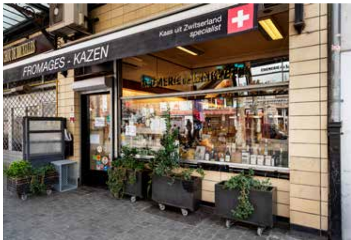
7. CRÈMERIE DE LINKEBEEK

→ Keer terug naar de Dansaertstraat, steek ze over en volg ze naar links, aan de kant met de pare huisnummers. Hou even halt bij huisnummer 16 en merk de merkwaardige gaten onderaan de gevel op.