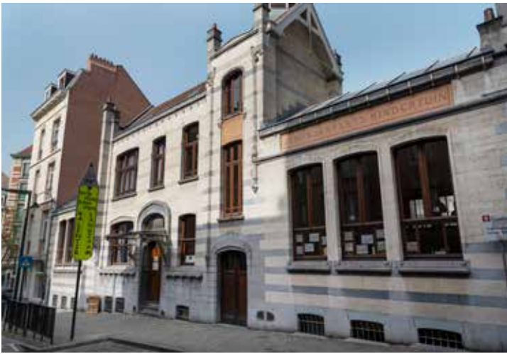
22. SCHOOL VICTOR HORTA