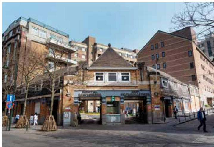
27. UMC SINT-PIETER

De stad was al bezig met de aanleg van fietspaden. Ze heeft die plannen naar aanleiding van corona versneld uitgevoerd om zo werk te maken van een gezondere stad. Het kan dus. Want niemand vatte het beter samen dan Juvenalis in de eerste eeuw na Christus: 'een gezonde geest in een gezond lichaam'!